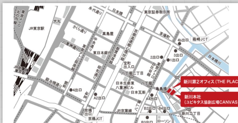
東京【新川オフィス】